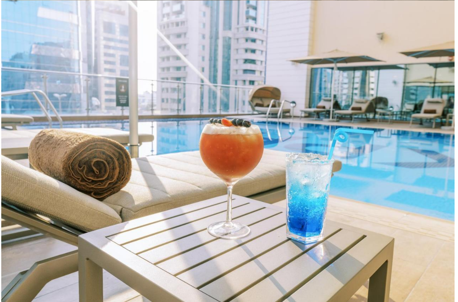
CROWNE PLAZA JUMEIRAH AND DEIRA 5*****