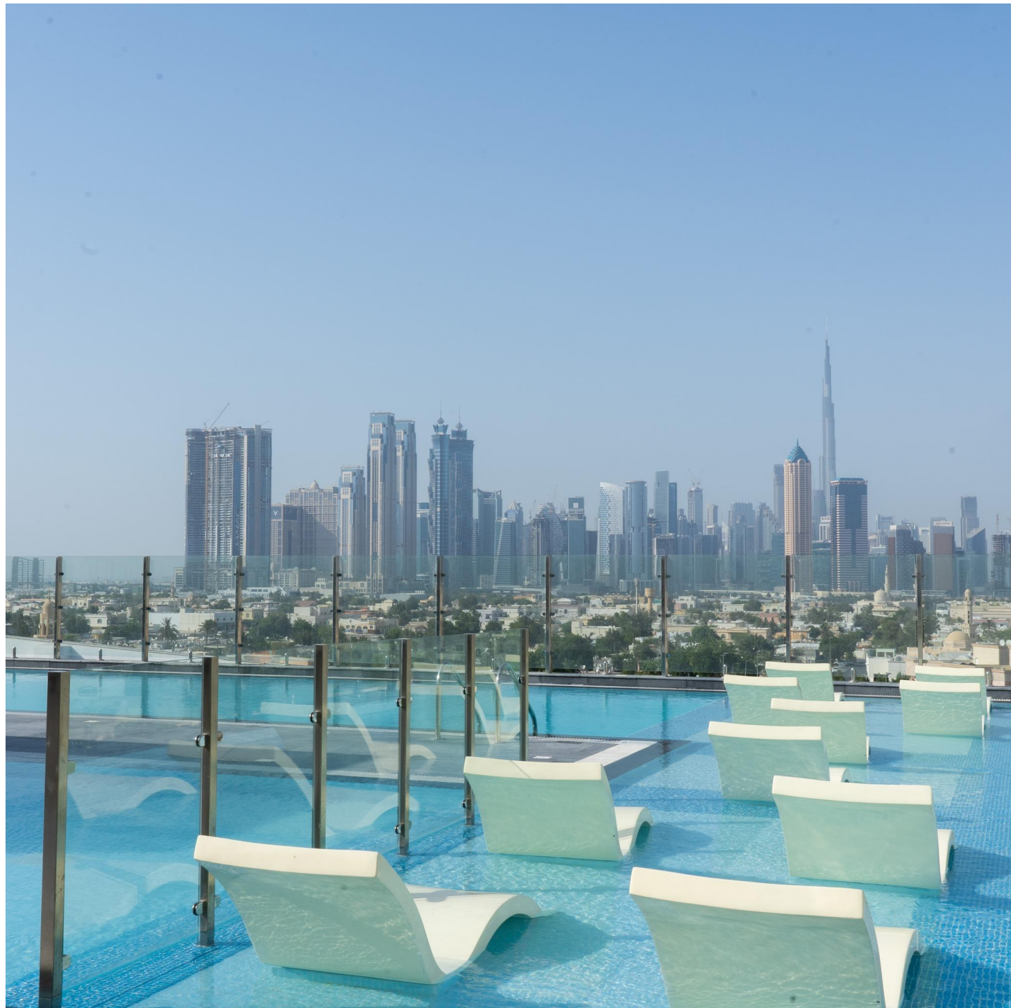
AL KHOORY COURTYARD 4*