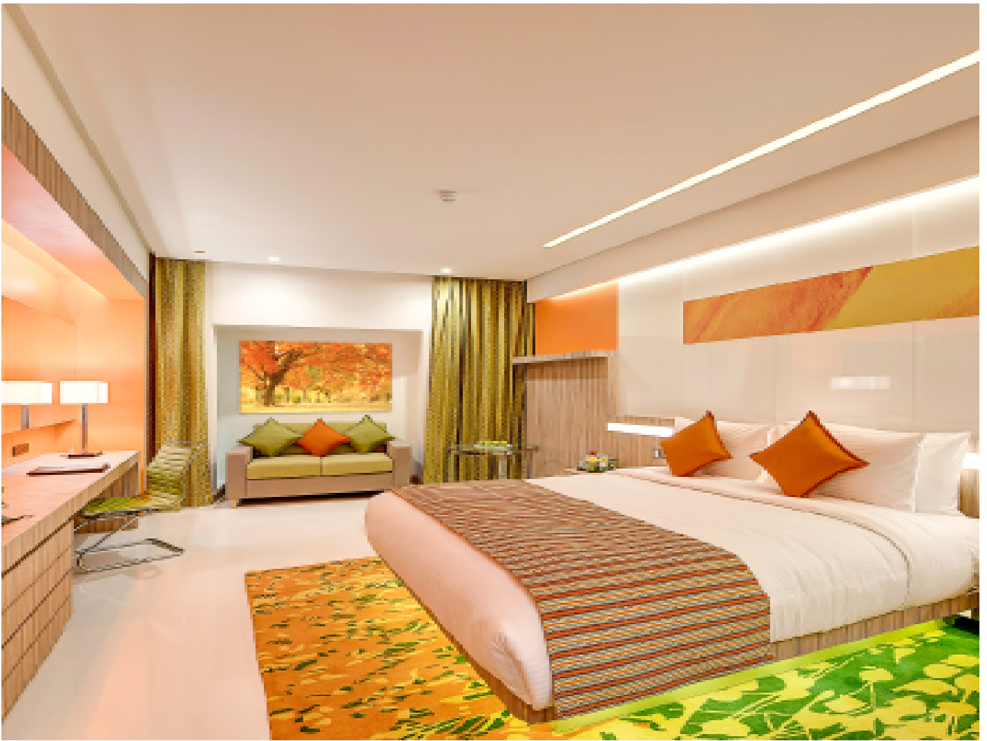
CROWNE PLAZA JUMEIRAH KAI DEIRA 5*****